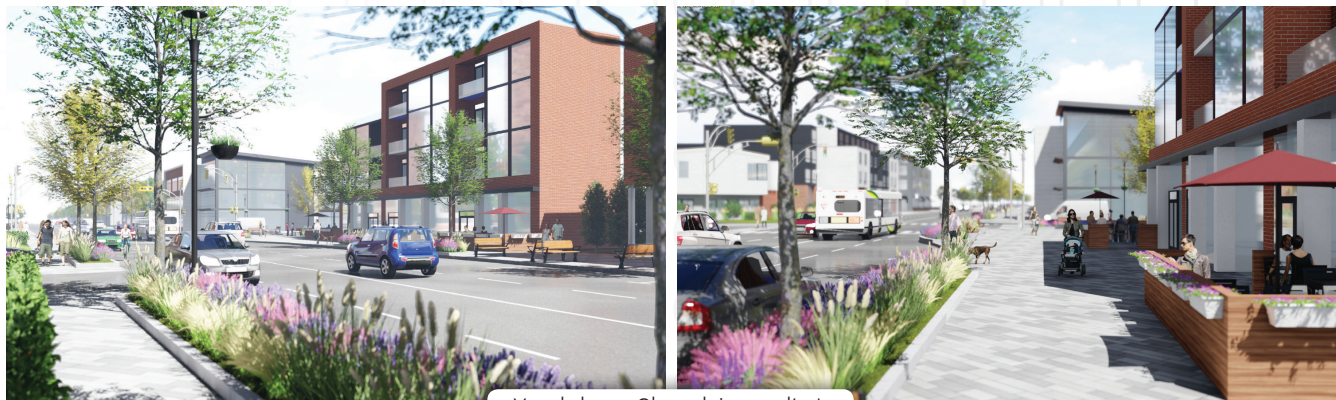
Vue de la rue Champlain, vers l'est