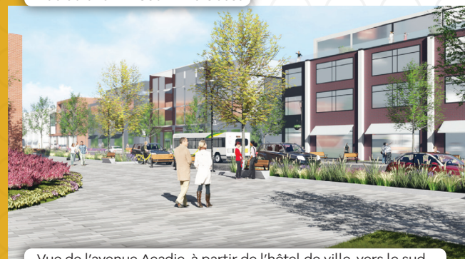
Vue de l'avenue Acadie, à partir de l'hôtel de ville, vers le sud