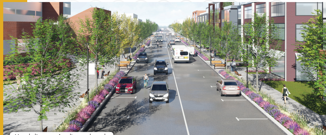
Vue de l'avenue Acadie vers le sud