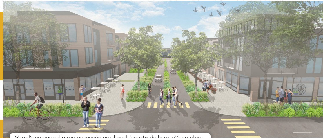
Vue d'une nouvelle rue proposée nord-sud, à partir de la rue Champlain.

Une rencontre de co-design avec les services municipaux et les parties prenantes a permis de venir valider certaines observations faites ainsi que d'entamer une réflexion sur le réaménagement du secteur.