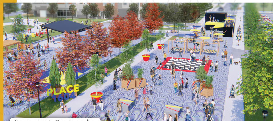
Vue du chemin Gauvin vers l'est

L'agrandissement du marché public et la mise en valeur de la Place 1604 à travers la réaffectation temporaire ou permanente du tronçon du chemin Gauvin qui les sépare constituent, en plus de la densification de certains sites potentiels, des interventions structurantes contribuant à l'animation du centre-ville. Finalement, l'aménagement de parcours conviviaux et sécuritaires pour les piétons et cyclistes à travers le centre-ville favorisera les déplacements actifs, bénéfiques à l'activité commerciale et à l'ambiance du milieu.