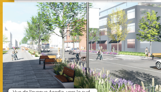
Vue de l'avenue Acadie, vers le sud